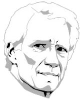
Dominique de Villepin

Q. En cas de crise grave en France, souhaitez-vous que chacune des personnalités suivantes revienne de façon active dans la vie politique ?